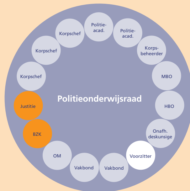
Samenstelling van de Politieonderwijsraad

Hoewel het een novum is in het politie(onderwijs)veld, bestaan vergelijkbare instellingen al langer in het veld van het (beroeps)onderwijs. Ook deze hebben een advies- en afstemmingsfunctie en spelen een rol in met name de afstemming van het onderwijs op de beroepspraktijk. Bij het opzetten van de Politieonderwijsraad heeft men zich laten inspireren door deze organen, zoals de Kenniscentra Beroepsonderwijs Bedrijfsleven en de Onderwijsraad. Dit is voor een deel terug te vinden in de samenstelling van de Raad, maar er zijn verschillen. In de eerste plaats zijn in de Raad diverse functies en rollen in één orgaan verenigd waardoor er geen stapeling is van belangenorganisaties in de relatief kleine politiesector. Ten tweede verschilt de Politieonderwijsraad vanwege het specifieke karakter van het politieonderwijs, waarin de Politieacademie veruit de belangrijkste aanbieder is. In de Raad is deze uitvoerende instelling met twee zetels stevig vertegenwoordigd en daarmee zelf direct betrokken bij de besluitvorming. Van dergelijke directe vertegenwoordiging is in de raden voor het reguliere onderwijs geen sprake. Ten tweede bestaan er verschillen vanwege de specifieke bestuurlijke en justitiële inbedding van de politie. In de Raad zijn daarom zowel het beheer, het gezag als de direct leidinggevenden (korpsschefs) vertegenwoordigd.