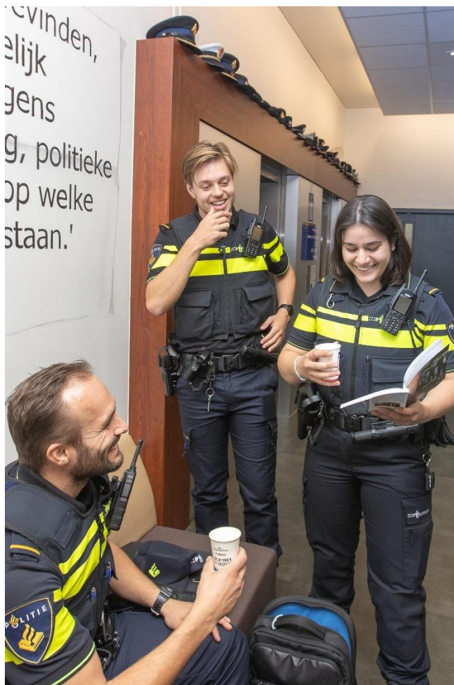
Studenten aan de Politieacademie Rotterdam